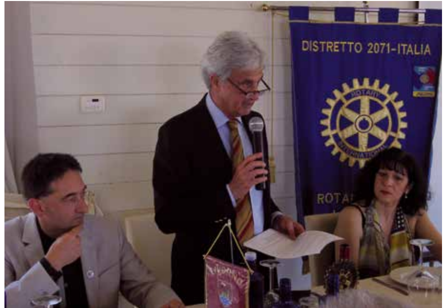
Il Presidente Costagliola mentre si appresta a destinare all'Associazione Amici della Zizzi il ricavato del concerto tenutosi presso il Teatro Goldoni.