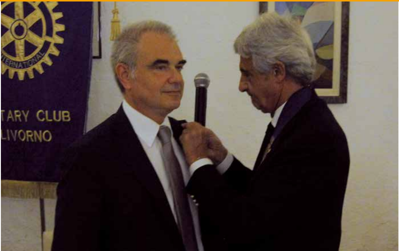
Un momento del passaggio delle consegne.