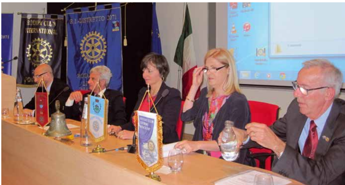
Il tavolo dei relatori durante l'Interclub tenutosi presso il Museo Piaggio.