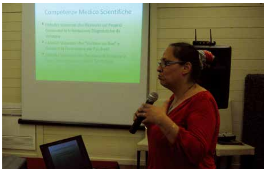
Un momento della presentazione del Progetto di Telemedicina Pediatrica della Repubblica Democratica del Congo.