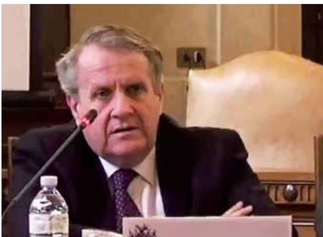
L’Ambasciatore Giovanni Brauzzi

Co-autore de “L’Italia all’ONU 1993 – 1999” e de “Quando la diplomazia fa gioco di squadra” del 2007, ha tenuto conferenze in numerose Università italiane e britanniche.