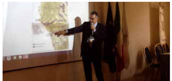
Il Presidente Giorgio Odello durante l'esposizione del suo intervento in occasione del Seminario Distrettuale del 16 settembre.

Di seguito pubblichiamo alcune immagini tratte dalla presentazione dei presidenti dei Club livornesi.