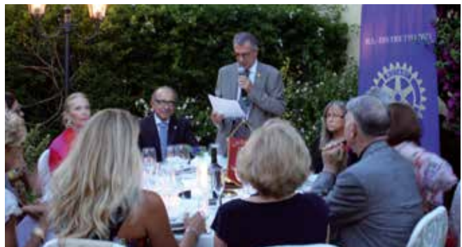
Il Presidente Odello introduce la serata del 20 Luglio.