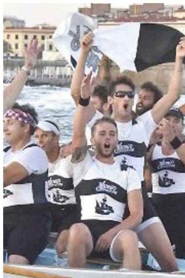
PASSIONE Il Palio marinaro coinvolge tanti giovani livornesi