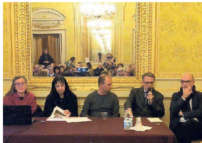
I protagonisti della cerimonia di consegna dei dipinti nella sala degli Specchi

Il Rotary club Livorno ha finanziato il lavoro sui 2 dipinti Saranno esposti nel Museo della Città ai Bottini dell'Olio