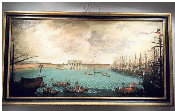
Il dipinto "Festa in Darsena"

za rotariana ed una grande attenzione verso i progetti rotariani dedicati alla cultura ma anche al sociale ed ai giovani in un intreccio virtuoso e nobile di sviluppo duraturo e sostenibile».