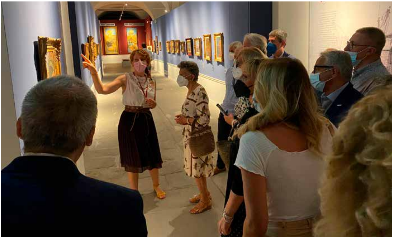
Visita alla mostra del pittore livornese Mario Puccini al Museo della Città'