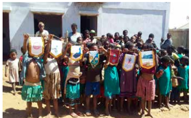
I bambini della Casa della Speranza con i gagliardetti dei club partecipanti al progetto Madagascar

I bambini del Distretto di Ambovombe, regione dell'Androy in Madagascar, ringraziano