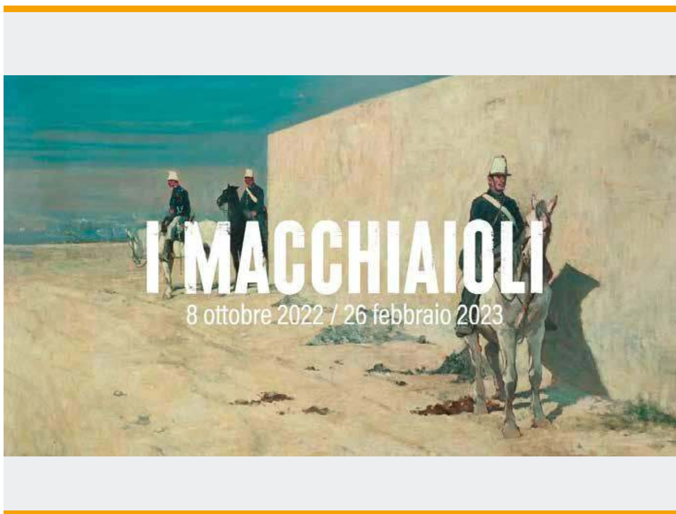
Locandina evento riproducente una famosa immagine di Giovanni Fattori

La mostra di Palazzo Blu ha raccolto le opere "chiave" di questo percorso allo scopo di cadenzare i diversi momenti della ricerca dei macchiaioli: il pubblico dei visitatori troverà a Palazzo Blu le risposte alle domande più ricorrenti: perché i Macchiaioli sono nati in Toscana? Possono essi ritenersi i pittori del Risorgimento? Perché sono considerati un'avanguardia europea?