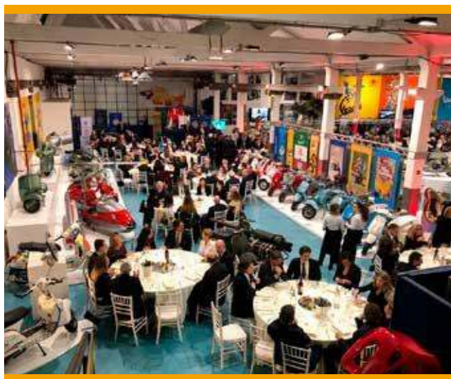
Un'immagine aerea di un salone del Museo Piaggio teatro della serata