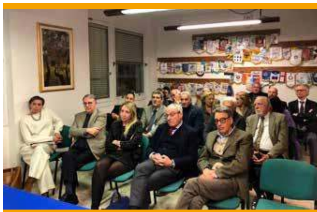
Sala del Club: immagine della platea intervenuta

8. I soci più giovani, in particolare i Rotaractiani,